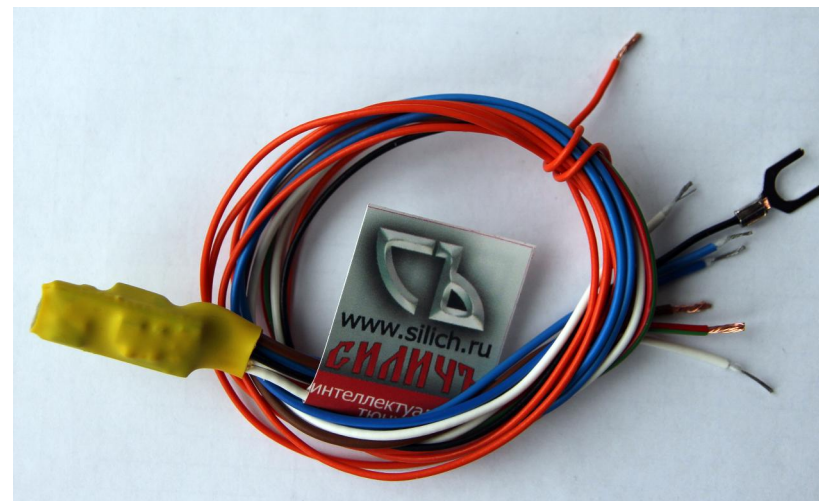
Рисунок 1 – Внешний вид устройства управления ДХО «СИЛИЧЬ-ЭКЛИПС»

Внешний вид устройства приведен на рисунке 1.