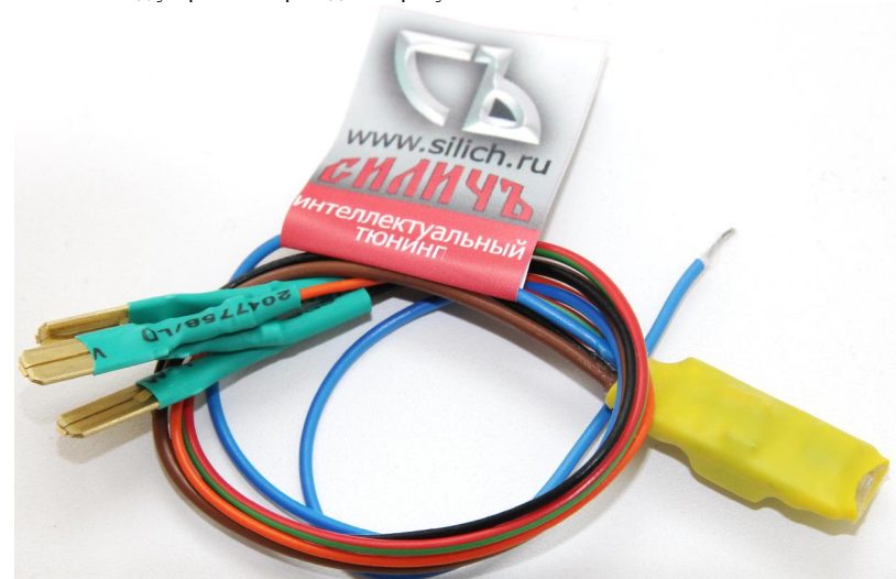
Рисунок 1 – Внешний вид устройства плавного включения фар «СИЛИЧЬ-ПРОМЕТЕЙ-А».

Внешний вид устройства приведен на рисунке 1.